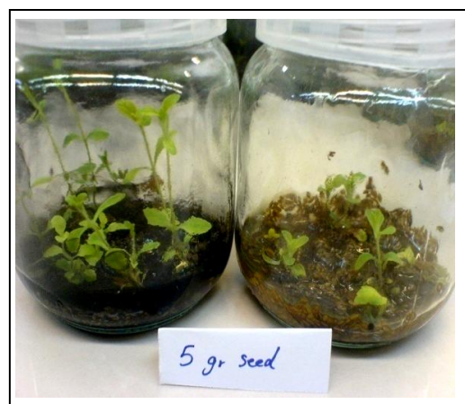
شکل ۴. ریزنمونه های استویا که در بسترهای ژله ایی شده به کمک مقادیر مختلف بذور اسفرزه، با حضور و عدم حضور زغال فعال، رشد یافته اند.