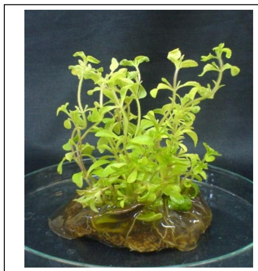
شکل ۲. ریزنمونه های استویا که در بسترهای ژله ای شده با کمک بذور اسفرزه رشد یافته اند