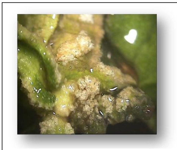
شکل ۳. تصویر میکروسکوپی از کالوس های رشد یافته روی ریزنمونه های استویا