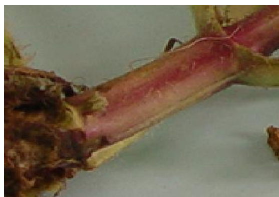
شکل ۳. سطح کرک‌دار ساقه گیاه S. macrosiphon