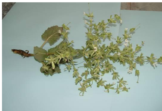
شکل ۱. تصویر گیاه S. macrosiphon