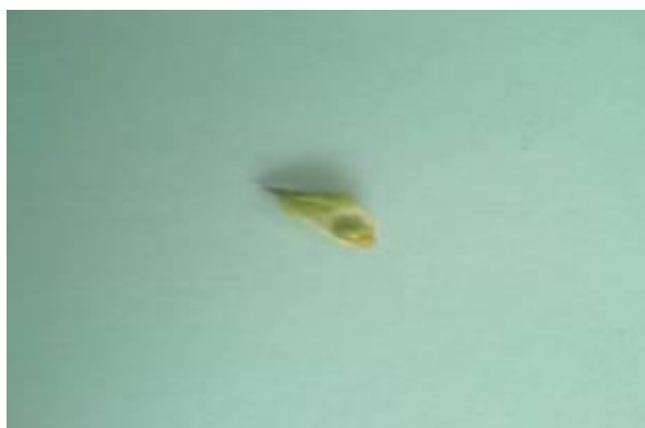
شکل ۱۸. میوه گیاه S. macrosiphon (×۴)

شده است و تعداد زیادی از این سلول ها تمایز پیدا کرده و تبدیل به کرک شده اند و کرک ها به صورت راست غده ای می باشند. در زیر بشره آن ها پارانشیم وجود دارد که ۳ تا ۴ لایه خارجی آن ها از سلول های فشرده و بدون مه آ و بقیه از سلول های درشت ترومه آدار است. این سلول ها در داخلی ترین لایه کاملاً فشرده بودند. در زیر بشره هر یک از گوشه ها بافت کلانشیم به صورت متراکم وجود داشت.