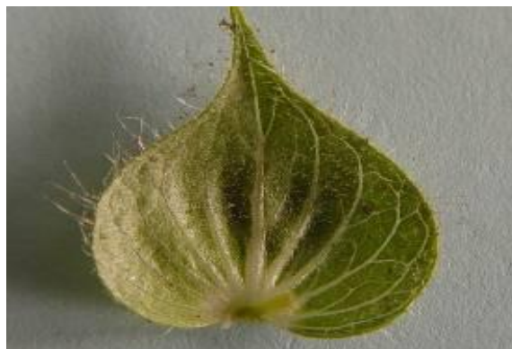
شکل ۱۳. براکته گیاه S. macrosiphon (×۴)