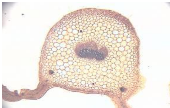
شکل ۲۲. برش عرضی برگ گیاه S. macrosiphon (×۱۰)

ترشگی بودند که هر دو نوع این کرک ها دارای یک ردیف سلول با اندازه متفاوت بودند و سلول تحتانی درشت تر بوده و به اپی‌درم مربوط می باشد.