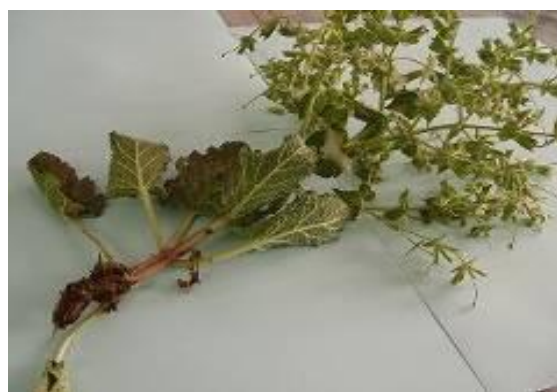
شکل ۲. ساقه گیاه S. macrosiphon