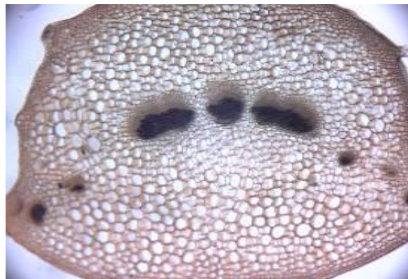
شکل ۲۱. برش عرضی دمبرگ گیاه S. macrosiphon (×۱۰)

در بررسی های ساقه، در سطح خارجی اپی‌درم کوتیکول مشاهده شد. با توجه به ارتفاع محل رویش و با توجه به کوهستانی بودن منطقه محل رویش، علت وجود لایه کوتیکول را می توان عامل اصلی جهت مقاومت نسبت به سرما و خشکی و تابش شدید نور خورشید دانست. بافت کلانشیم موجود در زوایای ساقه چهار گوش در این گونه باعث استحکام ساقه شده تا بتواند حالت طبیعی و برافراشتهگی خود را حفظ کند. نحوه ی استقرار دستجات آوندی در ساقه با دم- برگ مطابقت دارد و این مسأله نشان دهنده آن است که دستجات آوندی دم برگ از انشعابات دستجات آوندی ساقه حاصل شده است. ساختار و تراکم کرک ها در قسمت های مختلف ساقه و برگ کاملاً متفاوت بود. این مسأله بیان کننده این است که کرک ها در مراحل