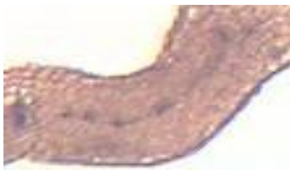
شکل ۲۳. مزوفیل برگ گیاه S. macrosiphon (×۱۰)

در بررسی های ساقه، در سطح خارجی اپی‌درم کوتیکول مشاهده شد. با توجه به ارتفاع محل رویش و با توجه به کوهستانی بودن منطقه محل رویش، علت وجود لایه کوتیکول را می توان عامل اصلی جهت مقاومت نسبت به سرما و خشکی و تابش شدید نور خورشید دانست. بافت کلانشیم موجود در زوایای ساقه چهار گوش در این گونه باعث استحکام ساقه شده تا بتواند حالت طبیعی و برافراشتگی خود را حفظ کند. نحوه ی استقرار دستجات آوندی در ساقه با دم- برگ مطابقت دارد و این مسأله نشان دهنده آن است که دستجات آوندی دم برگ از انشعابات دستجات آوندی ساقه حاصل شده است. ساختار و تراکم کرک ها در قسمت های مختلف ساقه و برگ کاملاً متفاوت بود. این مسأله بیان کننده این است که کرک ها در مراحل