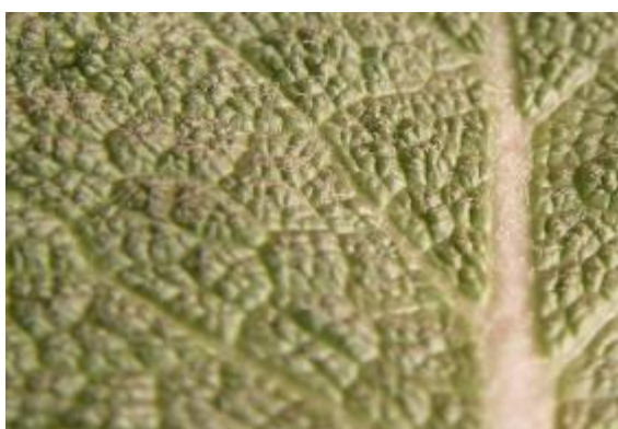
شکل ۵. کرک‌های سطح رویی برگ گیاه S. macrosiphon (×۴)