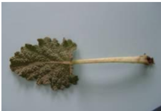
شکل ۴. برگ گیاه S. macrosiphon